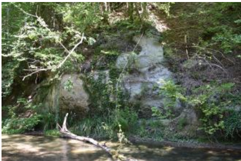
Prallhang aus Sandstein der Oberen Meeresmolasse im Aachtobel bei Überlingen-Lippertsreute

Das im Linzgau gelegene Flüsschen Aach (auch Linzer Aach) hat sich nach dem Abschmelzen der Gletscher am Ende der letzten Kaltzeit seinen Weg nach Süden ins Bodenseebecken gesucht und sich dabei zwischen Herdwangen-Schönach-Großschönach und Frickingen-Bruckfelden 80–120 m tief in die weichen Molassegesteine eingeschnitten. Besonders im unteren Talabschnitt zwischen Owingen-Hohenbodman und den zu Überlingen-Lippertsreute gehörenden Steinhöfen ist dabei ein imposanter rund 2 km langer schluchtartiger Talabschnitt entstanden. Ungefähr 200 m westlich der Steinhöfe sind am nördlichen Prallhang oberhalb einer flachen Halde bis zu 12 m mächtige Sandsteinschichten der tertiären Oberen Meeresmolasse aufgeschlossen. In diese weichen Sandsteine wurden Keller, Grotten sowie die Wallfahrtskapelle „Maria im Stein“ gegraben.