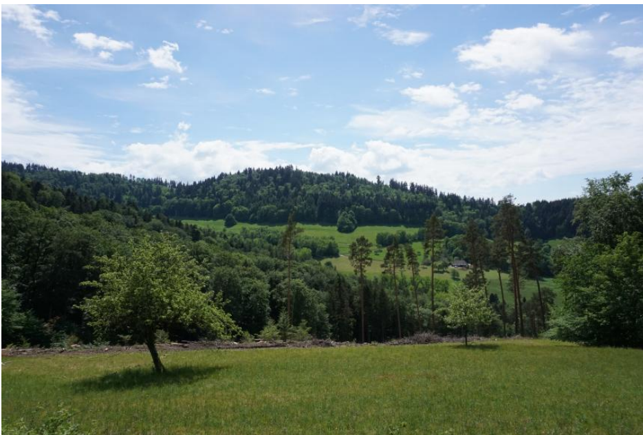
Blick von Norden auf das Fuchsköpfe östlich von Freiburg-Herdern