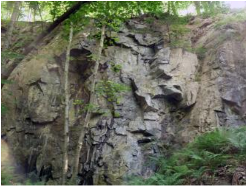
Ehemaliger Amphibolit-Steinbruch auf der Südseite des Fuchsköpfles, Freiburg im Breisgau