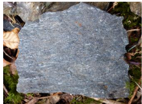
Amphibolit aus dem Steinbruch auf der Nordseite des Fuchsköpfles, Gundelfingen

Die Amphibolite liegen kleinflächig als linsenförmige Gesteinskörper zwischen den Gneisen des Schwarzwalds. Da sie der Verwitterung großen Widerstand entgegensetzen, wurden größere Vorkommen als Rücken und Kuppen in der Landschaft herauspräpariert. Die Amphibolite bestehen hauptsächlich aus dunkler Hornblende, Feldspat (Plagioklas) und Pyroxenen. Sie entstanden vorwiegend aus basischen Vulkaniten, die in der Zeit zwischen 480–440 Mio. Jahren aufdrangen. Während der variskischen Gebirgsbildung vor etwa 340 Mio. Jahren wurden sie unter hohem Druck und Temperaturen im Erdinnern zu Amphiboliten umgewandelt, während aus den benachbarten Sedimentgesteinen durch die Metamorphose Paragneise entstanden (Eisbacher & Fielitz, 2010). Aufgrund der räumlichen Nähe beider Gesteine während der Gebirgsbildung gibt es im Amphibolit am Fuchsköpfe Einschaltungen von Paragneis, der in diesem Teil des Schwarzwalds das vorherrschende Gestein darstellt. In der Umgebung der Amphibolit-Vorkommen treten z. T. hornblendeführende und dadurch olivgrün gefärbte Paragneise auf.