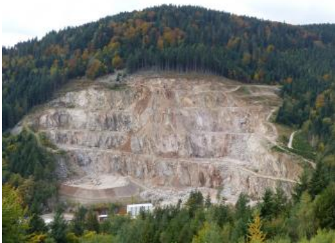
Steinbruch Wolfsbrunnen im Seebach-Granit

Der eindrucksvolle Steinbruch im Seebach-Granit liegt im Nordschwarzwald ca. 2,8 km nordöstlich von Seebach (Ortsmitte) an einer Spitzkehre der L87. Die gut 100 m hohe Wand weist steile, parallel zur Haupttrandverwerfung des Oberrheingrabens verlaufende Klüfte auf. Die OSO-einfallenden Klüfte bewirken eine gute Spaltbarkeit und damit die weitgehend bruchlose und glatte Abbauwand. Der Seebach-Granit ist grau oder leicht rötlich, fein bis mittelkörnig und gehört zu den Zweiglimmergraniten. Die hohe Druckfestigkeit und gute Spaltbarkeit macht den Seebach-Granit vom Wolfsbrunnen zum Werkstoff für haltbare Pflastersteine.