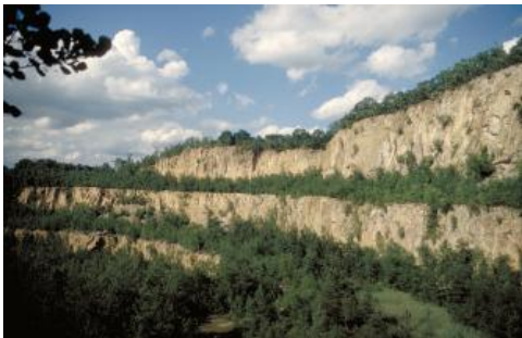
Aufgelassener Steinbruch am Ölberg südöstlich von Schriesheim

Der am Westrand des Odenwalds gelegene große aufgelassene Steinbruch am Ölberg südöstlich von Schriesheim ist mit seinen Felswänden schon von der Rheinebene aus zu erkennen. Der Dossenheim-Quarzporphyr wurde auf fünf sichelförmigen Sohlen mit jeweils über 20 m Höhe abgebaut, wodurch sich der Eindruck eines riesigen Amphitheatere ergibt. Es handelt sich um ein frisch grauviolettes bis hellrosafarbenes Gestein mit Einsprenglingen aus Feldspat, Quarz und Glimmer, das zum Abschluss des Vulkanismus im Rotliegend entstand. Der größte Teil des Materials wurde bei explosiven Glutwolkenausbrüchen ausgeworfen und nach dem Absinken sofort zu einem Festgestein verschweißt (Ignimbrit). Der Quarzporphyr im Steinbruch am Ölberg zeigt eine flachliegende, wellige Paralleltexur, die auf horizontale Fließbewegungen zurückgeht