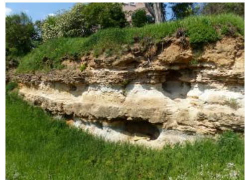
Aufschluss im Travertin südöstlich vom Bahnhof Bad Cannstatt in der Heinrich-Ebner-Straße

Weiterführende Informationen finden sich bei Bachmann & Brunner (1998), Brunner (1998b), Koban (1993), Reiff (1955) und Werner et al. (2013).