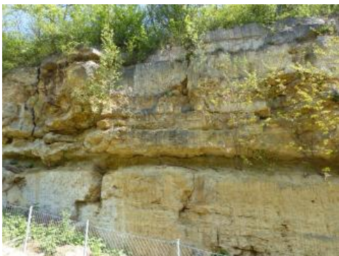
Von einem Lehmhorizont getrennte Travertinlager mit Abbauspuren im ehemaligen Steinbruch der Firma Haas in Stuttgart

Im Stadtgebiet von Stuttgart treten seit über 500 000 Jahren Mineralquellen aus, die an das Störungssystem des Fildergrabens gebunden sind. Diese Mineralwässer mit hohem Gehalt von Hydrogencarbonat, Kohlensäure, Sulfat und teilweise Eisen ließen mächtige Kalkabsätze (Travertine) entstehen. Sie bildeten sich während der Warmzeiten innerhalb des Pleistozäns. Während der Kaltzeiten waren die Böden häufig gefroren (Permafrost), so dass keine Wasserbewegung möglich war. Die Travertine bildeten sich auf Flussterrassen des Neckars, wobei über den Terrassenschottern Travertin-Mächtigkeiten bis zu 30 m entstanden, die sich über mehrere Kilometer verfolgen lassen. Das mineralhaltige Wasser verrieselte auf den Terrassen, verlor einen Teil des gelösten CO 2 und infolge dessen wurde der Kalk abgesetzt. Dazu kam Eisenocker, der den Travertinen von Stuttgart die charakteristische Gelb- und Brauntönung verleiht. Der mehrfache Wechsel von Warm- und Kaltzeiten führte zur Bildung