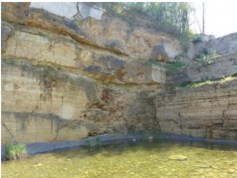
Ehemalige Abbauwand im Steinbruch der Firma Haas in Stuttgart

Der Abbau im Steinbruch der Firma Lauster in Stuttgart-Bad Cannstatt auf der linken Neckarseite ruht seit 2007. Es sind noch Restprofile des Travertins vorhanden. Insgesamt war hier eine bis maximal 25 m mächtige Abfolge mit 6 Travertinlagern aufgeschlossen, die durch „Lehmhorizonte“ aus Lösslehm oder Auenmergel getrennt sind oder sich durch Wechsel in Farbe und Struktur des Travertins unterscheiden. Unter dem Gesteinspaket mit dem Travertin finden sich ältere Auenmergel („Liegende Mergel“) und darunter Neckarschotter. Als Industriedenkmal steht auf dem heute von einem Recyclingbetrieb genutzten Gelände die historische „Lausterhalle“, in der früher die im Steinbruch gewonnenen Travertinblöcke in großem Umfang maschinell zu Werksteinen weiterverarbeitet wurden.