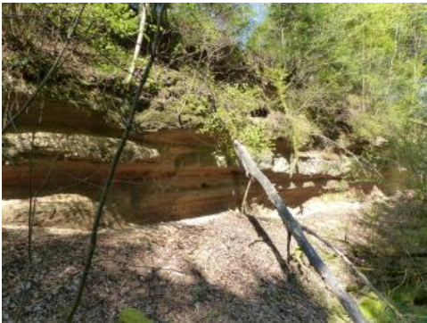
Verfallene und verbuschte Aufschlusswand im südlichen Teil der Sandgrube von Riedern am Sand

Der Abbau der Graupensande hatte seine Hochzeit in den zwanziger und dreißiger Jahren des 20. Jahrhunderts. Der Graupensand wurde damals über eine Wasserrutsche in das Quarzwerk in Riedern am Sand transportiert. Die Sande wurden dort gewaschen und je nach Verwendungszweck in passende Körnungen sortiert. Sie dienten als Putz- oder Formsand, für die Herstellung von Schmelztiegeln und Schmirgelscheiben, für Sandstrahlgebläse oder als Streusand für den Eisenbahnbetrieb sowie für Glasuren und in der Glasproduktion. Nach dem zweiten Weltkrieg verringerte sich die Nachfrage nach den Graupensanden und der nicht nutzbare Abraum wurde immer mächtiger, sodass der Abbau nun schon seit Jahrzehnten eingestellt ist. Dementsprechend verschlechtern sich die Aufschlussverhältnisse allmählich.