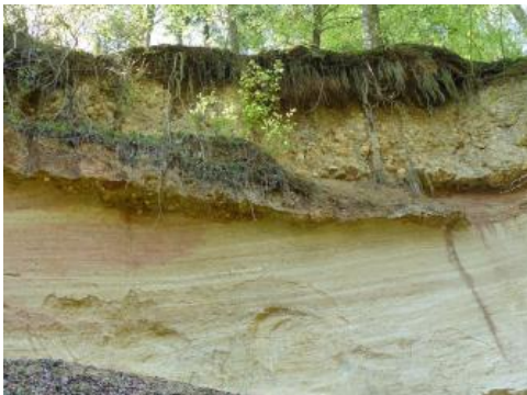
Aufschlusswand im nördlichen Teil der Sandgrube bei Klettgau-Riedern

Im Waldgebiet „Kätzler“ südwestlich oberhalb von Riedern am Sand (Gem. Klettgau) liegt eine inzwischen aufgelassene Sandgrube, in der tertiäre Graupensande der Grimmelfingen-Formation abgebaut wurden. Sie gehören zur Oberen Brackwassermolasse, in der Ablagerungen aus dem Übergang zwischen Land und Meer zusammengefasst sind. Über der Grimmelfingen-Formation finden sich harte Bänke der Austernnagelfluh, die aus der Wand vorspringen. Teilweise sind feinsandige Rinnenfüllungen zwischengeschaltet. Die Melaniensande schließen das Profil nach oben ab. Die Grube gilt als der beste Aufschluss dieser tertiären Ablagerungen auf dem Kleinen Randen.