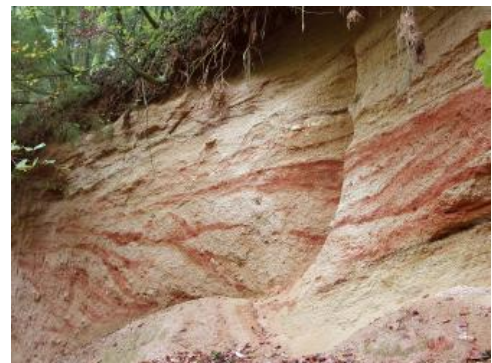
Graupensande mit durch Eisenoxide rot gefärbten Bändern in der Sandgrube von Riedern am Sand

Bei den Graupensanden handelt es sich um meist lockere Grobsande bis Feinkiese. Neben Quarzen und Feldspäten fallen schwarze Lydite (paläozoische Kiesel-schiefer) auf. Dieser Teil stammt aus der Böhmisches Masse und wurde aus nordöstlicher Richtung als Füllung eines Flusstals oder eines Mündungsbereichs eines Flusses ins Meer (Ästuar) abgelagert. Daneben enthalten die Graupensande Oberjura-Kalksteine und -Fossilien sowie Feuersteine und Bohnerze aus den nördlich und nordwestlich der Graupensandrinne gelegenen Juragebieten. Ältere Gesteine aus dem Deckgebirge sind ebenso wie alpine Gerölle nur vereinzelt zu finden. Vor allem im südlichen Teil des Aufschlusses zeigen sich zu einem „Graupensand-Konglomerat“ verbackene Schichten, die rinnenförmig in die Sande eingeschnitten sind. Den Abschluss der in Riedern bis zu 20 m mächtigen Grimmelfingen-Formation bilden z. T. feinsandige oder zu Sandstein oder Nagelfluh verfestigte Rinnenfüllungen.