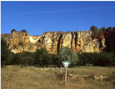
Aufgelassener Steinbruch am Moldenberg nordöstlich von Heidenheim an der Brenz

Der aufgelassene Steinbruch am Moldenberg auf der östlichen Schwäbischen Alb nordöstlich von Heidenheim an der Brenz erschließt den Brenztal-Trümmerkalk (früher Brenztal-Trümmeroolith). Dabei handelt es sich um ein gelblich-braunes, grobkristallines Gestein aus Riffschutt wie Trümmern von Seelilien, Seeigeln, Brachiopoden und Muscheln. Stellenweise kommen dazu untergeordnet kleine Ooide, die durch konzentrische Anlagerung von Kalk um ein Fossilbruchstückchen o. ä. entstanden sind. Der Brenztal-Trümmerkalk ergab einen gesuchten Werkstein, der als „Heidenheimer Stein“ bis nach Wien vermarktet wurde. Die Bildung des Brenztal-Trümmerkalks reicht stratigraphisch in die Zeit des obersten Oberjuras (Mergelstetten-Formation, früher Weißjura zeta 2). Im Steinbruch Moldenberg konnten Schrägschichtungen nachgewiesen werden, die auf eine Strömungsrichtung von Südwest nach Nordost hindeuten. In der oberen Steinbruchwand finden sich zahlreiche Karstschlotten mit