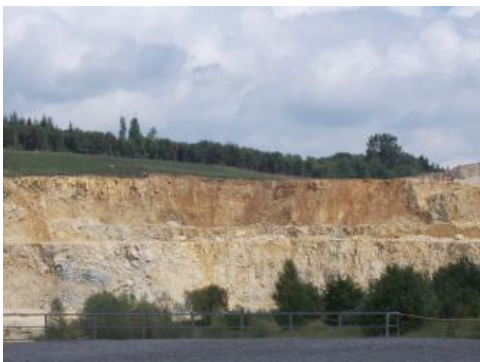
Steinbruch östlich von Heidenheim-Mergelstetten

Der große Steinbruch auf der östlichen Schwäbischen Alb bei Heidenheim-Mergelstetten reicht in einer Ausdehnung von über 2,5 km vom östlichen Ortsrand von Mergelstetten bis zum Gewinn Schaubacker. Er erschließt nahezu die gesamte Abfolge der Mergelstetten-Formation im Oberen Oberjura. Die Zementmergel und Bankkalk stehen hier in bis zu 122 m Mächtigkeit an. Nach Norden wird das Vorkommen von Massenkalken begrenzt, die den Rand der Zementmergelschüssel von Mergelstetten darstellen. Von diesem Rand fallen die Schichten mit 10–15° zum Zentrum der Schüssel ein. Auffallend sind in diesem Steinbruch die Zwischenkalken innerhalb der Zementmergel, ein mergelig-kalkiger Schichtenstoß, der oben wieder von Zementmergeln bedeckt wird. Aufgeschlossen sind ferner mehrere Massenkalkstotzen, an denen der Übergang von geschichteter (gebankter) Fazies zur Massenkalkfazies deutlich zu erkennen ist.