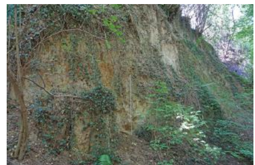
Lösswand mit Paläoboden in der Leimtalgasse östlich von Kippenheim

Kurz vor dem östlichen Ende des Hohlwegs ist mit einem rotbraunen Tonanreicherungshorizont (Bt-Horizont) ein gut erhaltener Paläoboden zu sehen. Seine Lage etwa 3 m unter der Obergrenze des Lösses macht es wahrscheinlich, dass es sich um den Rest einer Parabraunerde der Eem-Warmzeit (126 000–115 000 Jahre v. H.) handelt. Die Leimtalgasse wird heute nur noch als Fußweg genutzt, sodass eine weitere Eintiefung durch das Befahren mit landwirtschaftlichen Fahrzeugen unterbleibt. Das lockere Material wird nicht mehr bei Starkniederschlägen weggeschwemmt. Die Wände sind deshalb zu großen Teilen von verstäurtem Material bedeckt und verwachsen.