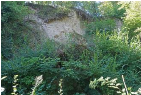
Lösswand im Hohlweg Leimtalgasse östlich von Kippenheim

Östlich von Kippenheim hat sich durch Jahrhunderte dauernde Benutzung ein tiefer Hohlweg gebildet, der hinauf in die Weinberge am Lußbuck führt. An den bis zu 15 m hohen Wänden sind mächtige Lössе aufgeschlossen, die während der Kälteperioden der letzten Eiszeiten aus den vegetationsarmen Schotterfluren der Rheinebene ausgeblasen und an den Vorbergen des Schwarzwalds in dicken Paketen abgelagert wurden. Dieser Hohlweg erschließt die mächtigsten Lössablagerungen der Ortenau. Die Leimtalgasse steht als Biotop auf 1,2 ha unter Naturschutz.