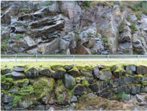
Erzenbach-Komplex, Straßenaufschluss im Tal der Kleinen Kinzig

Der Erzenbach-Komplex besteht aus einem metasomatisch überprägten Granitoid, welches mit dem Triberg-Granitpluton, Granitporphyren sowie mit Gneisen assoziiert ist. Der Gesteinskörper liegt bei Alpirsbach in einer Gneis-Linse innerhalb des Triberg-Granitkomplexes, z. T. direkt am Kontakt zum Granit. Südlich von Hausach im Kinzigtal (westlich des Triberg-Granits) befindet sich das Gestein im Gneis-Migmatit-Komplex des Mittleren Schwarzwaldes. Dort tritt es in gangartiger Ausprägung in enger Assoziation mit Granitporphyr-Gängen auf (Sauer, 1897). Die Entstehung und Gesteinsassoziation ist nicht abschließend geklärt. Das Gestein wurde früher als Syenit oder Quarzglimmersyenit angesprochen und als eine Randfazies des Triberg-Granits interpretiert (Brauhaus & Sauer, 1913, Sauer, 1897). Später wurden metasomatische Überprägungen identifiziert (Geyer et al., 2011). Für den Durbachit-Komplex, einer