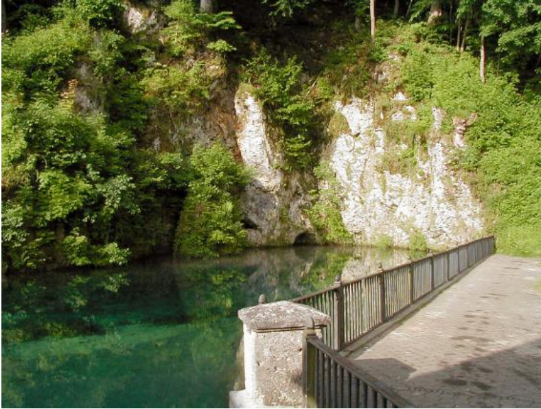
Der Brenz-Ursprung oder Brenztopf im Ortsbereich von Königsbrunn ist einer der schönsten Quelltöpfe der Schwäbischen Alb. Der Austritt der Brenz am westlichen Brenztalrand steht mit der Königsbronner Schichtlagerungsmulde in Zusammenhang.

Im Rahmen der Hydrogeologischen Kartierung Ostalb (HGK, 2002) wurde die hydrologische Situation der Brenz und ihre Wechselwirkung mit dem Karstgrundwasser näher untersucht (Schloz, 1999).