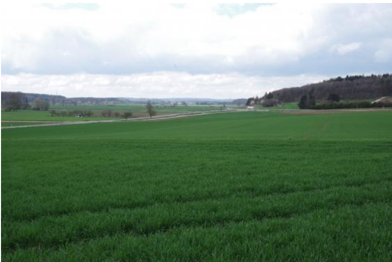
Die Talfüllung des Brenztales besteht aus bis zu mehreren Zehner Metern mächtigen Kiesen mit Sand- und Schluffeinlagerungen. Die Kiesgerölle entstanden aus aufgearbeitetem Oberjura-Kalkstein.

Der Fließweg der Brenz von ihrer Quelle beim Seegartenhof, ungefähr zwei Kilometer nordwestlich von Königsbrunn, bis Sontheim an der Brenz beträgt etwa 50 Kilometer. Auf dieser Strecke nimmt sie, als einzigen größeren, permanent oberirdischen Zufluss, die Hürbe bei Hermaringen auf. Alle anderen Bachläufe, wie z. B. der Nattheimer-Talgraben, der Haintalgraben oder der Wedel im Stubental bei Heidenheim an der Brenz, sind zeitweilig trocken.