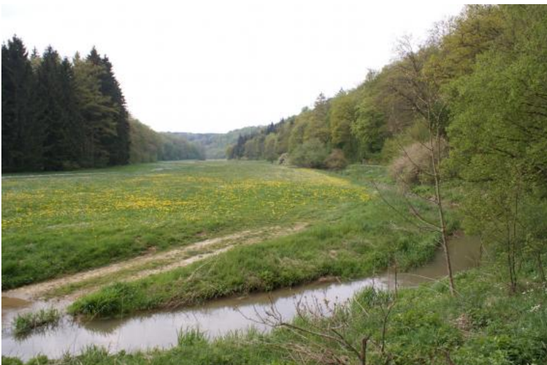
Die Lone nimmt auf ihrer ca. 33 Kilometer langen Fließstrecke Oberflächenwasser aus zahlreichen, nicht genauer lokalisierbaren Quellen auf.

Binder (1960) vermutet einen Abfluss von den Versickerungsstellen zum Nau-Ursprung. Meist im Herbst versickert die Lone unterhalb von Setzingen/Bissingen komplett. Nur in niederschlagsreichen Jahren erreicht sie rund 1 km westlich von Burgberg ganzjährig die Hürbe.