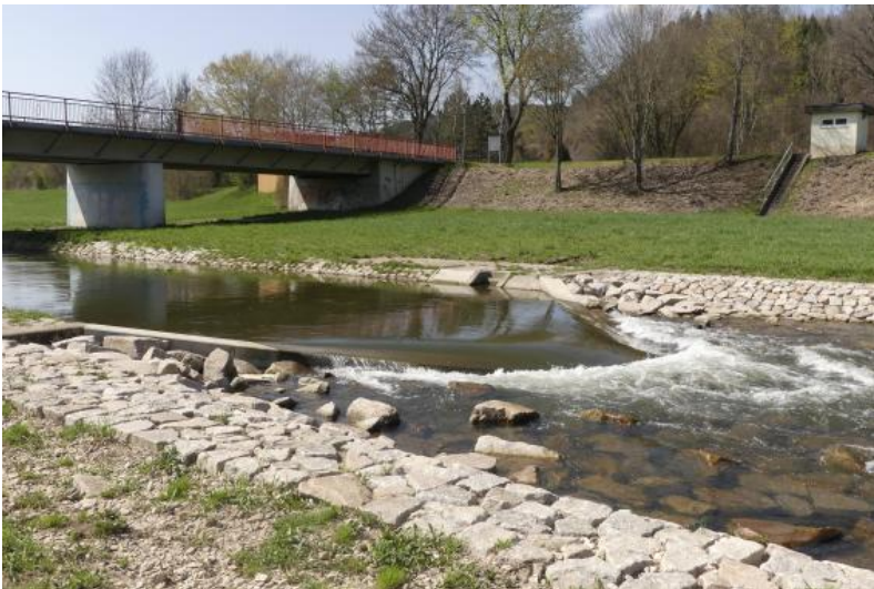
Pegel an einem Oberflächengewässer: Donaubrücke bei Tuttlingen-Möhringen

Ebenfalls auf der Seite der Hochwasservorhersagezentrale der LUBW ist eine landesweite Übersicht über vorhandene Pegel an Oberflächengewässern verfügbar (HVZ Baden-Württemberg - LUBW, Link s. unten).