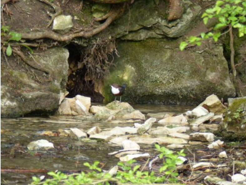
Der Schwarze Kocher entspringt im Seichten Karst unterhalb des Osthangs der Schmiedehalde ca. 1000 m südlich der Ortsmitte von Oberkochen an der Grenze der Impressamergel-Formation zur Wohlgeschichtete-Kalke-Formation.

Der Schwarze Kocher entspringt ungefähr 1 km südlich von Oberkochen, der Weiße Kocher aus einer Quellgruppe etwa 2 km östlich des Ortskerns von Unterkochen. Der über eine Regionalisierung (Stand 01.03.2016) ermittelte mittlere Abfluss des Schwarzen Kochers beträgt unterhalb des Quellaustritts nach einer Fließstrecke von etwa 4,5 km am Pegel Stefansweiler Mühle 1,02 \text{ m}^3/\text{s} , der des Weißen Kochers am Pegel Unterkocher 0,44 \text{ m}^3/\text{s} (HVZ-Pegelkarte - LUBW, Link s. unten). Zuvor nimmt der Weiße Kocher ca. 0,065 \text{ m}^3/\text{s} aus dem Häselbach auf (HGK, 2002).