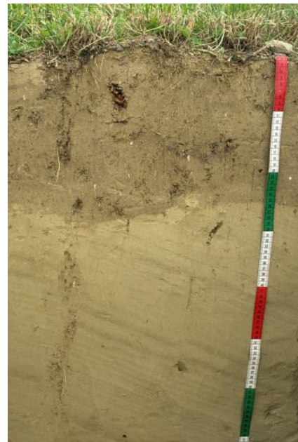
Pararendzina aus würmzeitlichen Seeablagerungen im Frickinger Becken (U13)

32 geologische Einheiten wurden als bindig kompressible Lockergesteine eingestuft, die zu Setzungen neigen können. Dazu gehören u. a. Auenlehme , Hochflutlehme und Fließberdefolgen , aber auch regional auftretende Einheiten wie z. B. das Hasenweiler-Beckensediment .