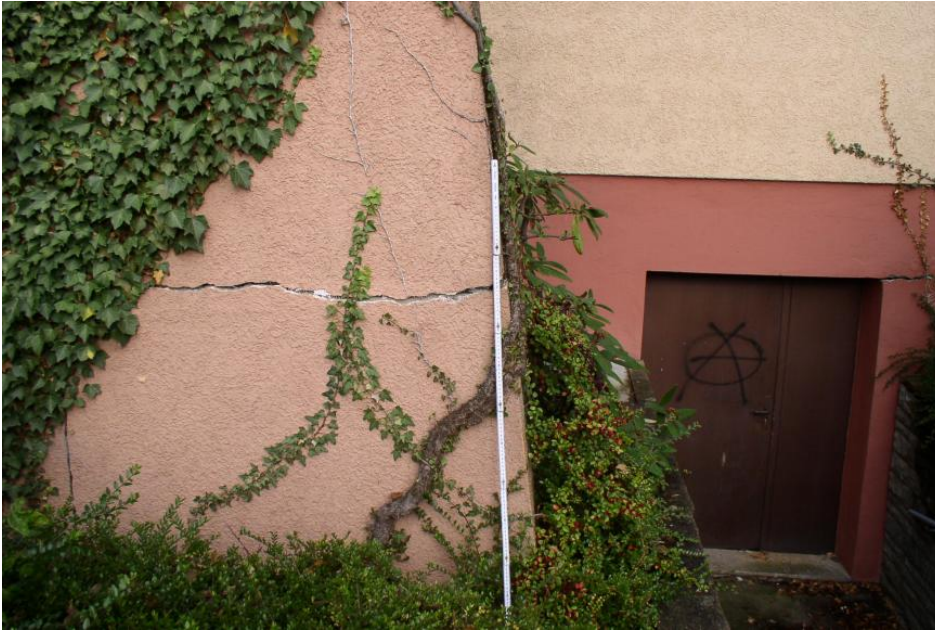
Setzungsrisse an einem Gebäude in Mössingen-Gomaringen

Die Entstehung von Fließerde ist hingegen nicht an aquatische Transport- und Ablagerungsprozesse gebunden. In Baden-Württemberg bildete sich Fließerde vor allem während einer Kaltzeit. Dies geschieht bereits ab einer Hangneigung von 1–2°, wenn Permafrostboden oberflächlich auftaut und sich der Boden durch wasserübersättigtes, zähbreiiges Fließen (Makrosolifluktion, Gelifluktion) sowie durch Frosthub und damit verbundenem Materialtransport beim Wiederauftauen in Gefällerrichtung bewegt (Mikrosolifluktion, Frostkriechen). Fließerden setzen sich meist aus Schluff und Sand mit wechselnden Nebenanteilen aus Kies, Steinen und anderen Umlagerungsbildungen zusammen.