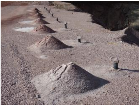
Vorbereitung von Sprengbohrlöchern entlang der Abbaukante im Steinbruch Tennenbronn (RG 7816-1)