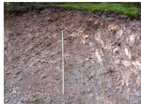
Durch oberflächennahe Prozesse zerstückelter, z. T. vergusender Kienbach-Granit

Der Kienbach-Granit ist selten aufgeschlossen; er ist oft stark zerklüftet und kleinstückig zerbrechend. Daher lassen sich große Rohblöcke voraussichtlich nicht gewinnen. Innerhalb des Rohstoffkörpers gibt es oft an Talungen gebundene als auch unvermittelt auftretende Störungszonen. Das Gestein kann hier bevorzugt zerrüttet, kataklasiert und/oder vergrust sein, was eine Qualitätsminderung bedeutet. Störungen sind bevorzugte Bereiche in denen Schwermetallanreicherungen auf mineralisierten Gängen und Letten auftreten können. Aufgrund des festeren Kornverbands im Vergleich zum Triberg-Granit wird mit keiner intensiven, oberflächennahen Vergüstung gerechnet.