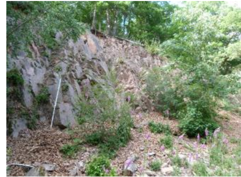
Aufschluss des Kienbach-Granits mit engständiger Klüftung

Der Kienbach-Granit ist eine Sonderfazies des Triberg-Granits und kommt rund um das Schiltachtal nördlich von Schramberg vor. Es handelt sich um unregelmäßig geformte, massige Gesteinskörper innerhalb des Triberg-Granits, die durch Auskristallisation aus einer sauren magmatischen Schmelze im Karbon entstanden sind. Die Übergänge zum Triberg-Granit sind hauptsächlich abrupt mit z. T. verzahnten Grenzverläufen, wie z. B. am östlichen Hang des Schiltachtals. Der Lagerstättenkörper liegt in Form mehrerer Linsen vor; teilweise wurden Schlieren und Stöcke beschrieben (Schleicher & Fritsche, 1978). Der Granit ist petrographisch ein relativ einheitlicher Gesteinskörper und für die Rohstoffgewinnung überwiegend geeignet. Es können Störungszonen auftreten, die sich oft durch tiefe Eintalungen andeuten, aber auch unvermittelt im Rohstoffkörper vorkommen können. Das Kluftsystem zeichnet sich durch entgegengesetzte Einfallrichtungen mit einem Streichen von NNO–SSW bis ONO–WSW sowie W–O und N–S aus; lokale Abweichungen sind möglich. Hinzu kommen überwiegend engständige, teilweise mittelständige Kluftabstände. Diese Eigenschaften begünstigen die Bildung von kleinen, spitzwinkligen Blöcken. Einzelne NW–SO bis NNO–SSW streichende Granitporphyr-Gänge durchschlagen den Kienbach-Granit. Sie können eine Länge von bis zu mehreren Kilometern sowie Mächtigkeiten von einigen 10er Metern aufweisen.