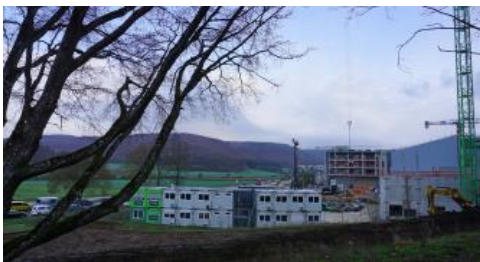
Bautätigkeit in der Siedlungsgasse des Kocher-/Brenz-Talzugs südlich von Oberkochen

Die Bodengroßlandschaft Albuch und Härtsfeld (Östliche Alb, Ostalb) umfasst eine Fläche von rund 1120 km 2 . Davon werden etwa 6 % von Siedlungen und Flächen der technischen und sozialen Infrastruktur (Verkehrswege, Sportgelände usw.) eingenommen. Diese in Kartiereinheit 3 zusammengefassten Bereiche werden in der Bodenkarte nicht näher beschrieben. Die Böden sind dort überwiegend entfernt, versiegelt, mit Fremdmaterial überdeckt oder stark verändert. Weitere 0,7 % der Bodengroßlandschaft werden von Aufschüttungen (Deponien, Dämme usw.) sowie Steinbrüchen, Gruben und sonstigen Abgrabungen eingenommen (Kartiereinheiten 1, 2).