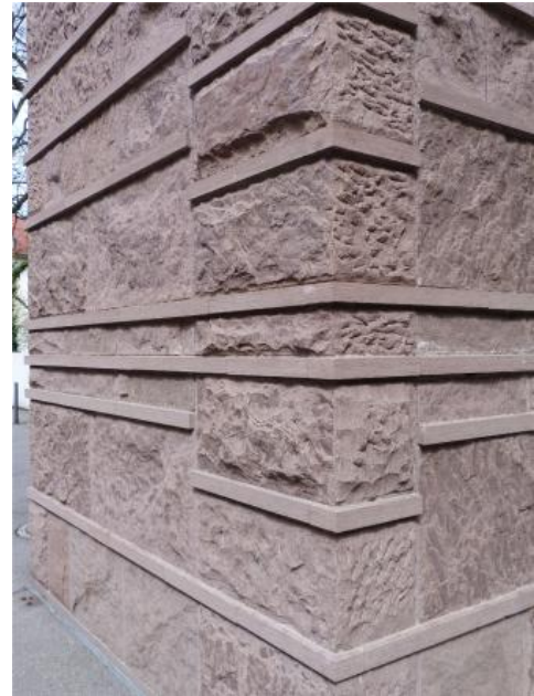
Fassade aus Maulbronner Sandstein am Erzbischöflichen Archiv in Freiburg

Verwendung: Der Schilfsandstein gehört zu den wichtigsten und am häufigsten als Bildhauermaterial verwendeten Werksteinen unseres Landes. Anders als Buntsandstein, Stubensandstein, Rhätsandstein und Eisensandstein, die auch in anderen Regionen Deutschlands weite Verbreitung besitzen, ist der Schilfsandstein ein überwiegend in Südwestdeutschland gewonnenes und genutztes Naturwerksteinmaterial. In großen Lagerstätten haben sich daher seit Jahrhunderten betriebene Abbauzentren entwickelt. Besonders durch die zum UNESCO-Weltkulturerbe zählende Klosteranlage von Maulbronn ist er über die Grenzen des Landes hinaus berühmt geworden.