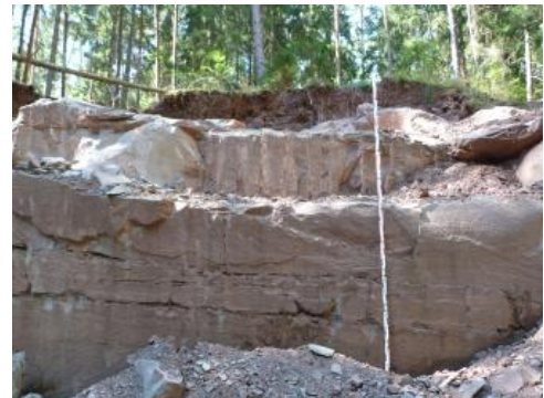
Abbauwand im Schilfsandsteinbruch Sulz am Neckar- Renfrizhausen (RG 7619-9)

Genutzte Mächtigkeit: In Flutfazies können auch mächtige, sandige Tonsteinfolgen als Zwischenlagen auftreten (Brunner, 1986a). Meist liegen die Mächtigkeiten in der Werksteinfazies um 8–10 m, z. T. um 20 m.