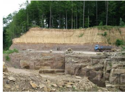
Schilfsandsteinabbau bei Mühlbach

Der Schilfsandstein ist Teil des nordischen Keupers, welcher durch nördliche bis nordöstliche Schüttungsrichtungen charakterisiert ist (Wurster, 1964a). Die Stuttgart-Formation umfasst zuoberst die Dunklen Mergel und im Liegenden davon den Schilfsandstein, der sich aus den verschiedenen Sedimentgesteinen der Normal- und Flutfazies zusammensetzt. Kennzeichnend ist, dass sich die beiden Faziesbereiche lateral miteinander verzahnen. Die Flutfazies ist dabei rinnenförmig in die Normalfazies eingetieft. Der Schilfsandstein in der Normalfazies lagert diskordant auf den Tonsteinen der Oberen Bunten Estheriensichten (Obere Grabfeld-Formation). Die Ablagerungen der Flutfazies haben sich dagegen lokal bis in die Gesteine der Mittleren Grabfeld-Formation eingeschnitten