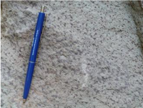
Nahaufnahme des Renfrizhauser „Forellensandsteins“