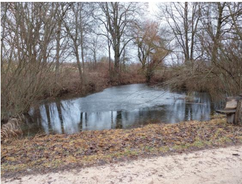
Die Hüle von Ehingen-Frankenhofen befindet sich ca. 400 m ostnordöstlich von Frankenhofen im Oberen Massenkalk. Sie hat einen Durchmesser von ca. 20 m und ist etwa 1 bis 2 m tief. Die Hüle ist die einzige Wasserstelle im Ort. Ihr Wasser dient der Feuerwehr als Löschwasser.

Bis 1870 erfolgte die Wasserversorgung der durch Wassermangel charakterisierten Albhochfläche durch Sammeln von Regenwasser in Zisternen und Dachbrunnen oder durch so genannte Hülen. Das waren meist künstlich angelegte, mit Lehm abgedichtete Teiche in Siedlungsnähe. Insbesondere die hygienische Beschaffenheit und das Dargebot derart gesammelter Niederschlagswässer waren unzureichend. Gelegentlich wurden auch schwach schüttende und bei Trockenheit häufig versiegende Quellen bzw. flache Brunnen genutzt.