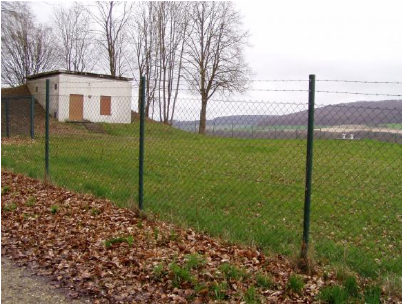
Brunnen Zwiefaltendorf: Fassungsbauwerk im umzäunten Fassungsbereich (Wasserschutzgebietszone 1)

Tiefbrunnen 2 Spitzäcker: Fassungsbauwerk (links) und Brunnenkopf (rechts)